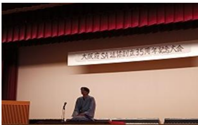
落語 関西大学文化会 落語大学