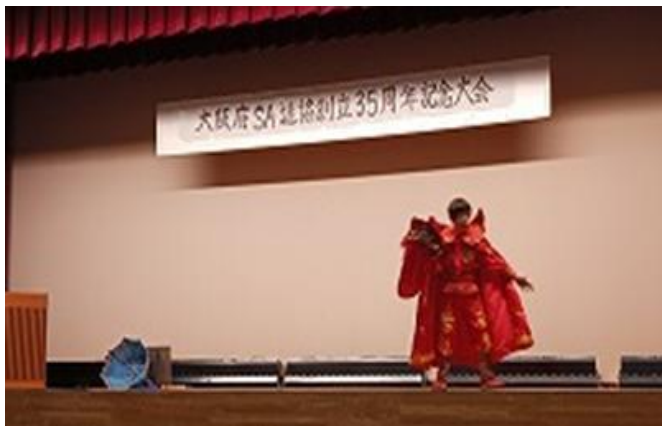
変面ショー・ミナクル Michiko