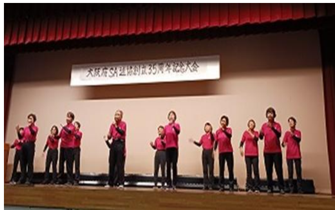
SA 連協 歌体操部会メンバー