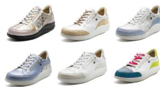
ドイツ製フィンコンフォート

23年間で23,000足の製作実績！ NHKニュースの特集で匠の技として紹介！ 当店独自の難しい技術です！