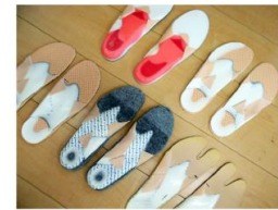
歩行改善インソール