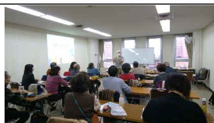
クラフト工作＝紙からくり