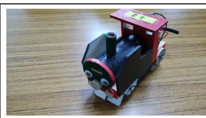
科学工作＝走るトーマス