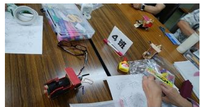
科学工作 走るトーマス