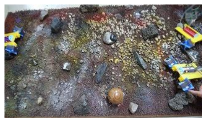
科学工作 火星探査車ロボット