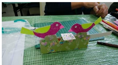
クラフト工作 餌をついばむ小鳥