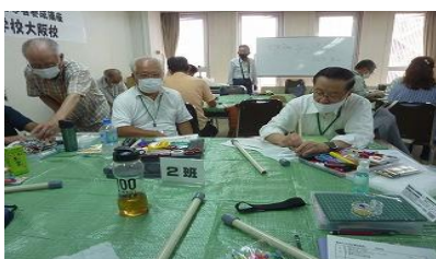
クラフト工作 =登るてんとう虫