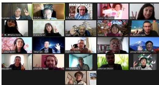
トルコアンカラとのズーム交流会