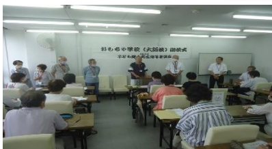
開校式 2021. 4. 20