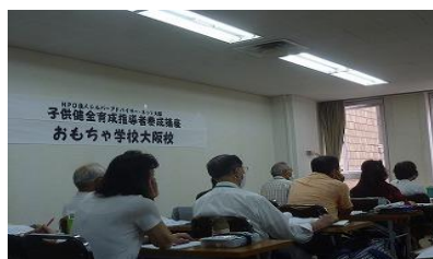
座学 ものづくり教育論