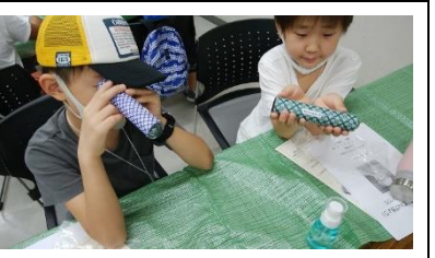
完成出来映え確認