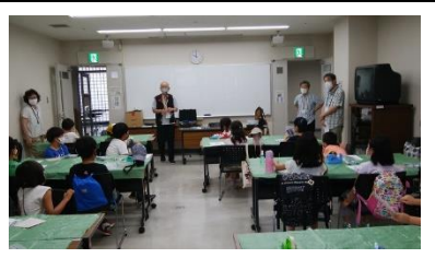
ベテラン講師指導