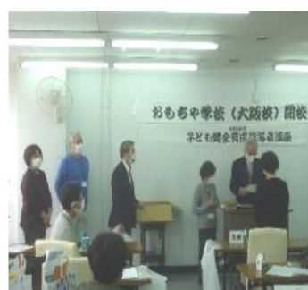
修了証書、記念品授与