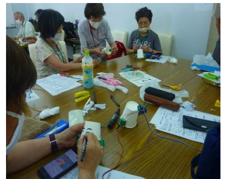
科学工作「ロボット」3