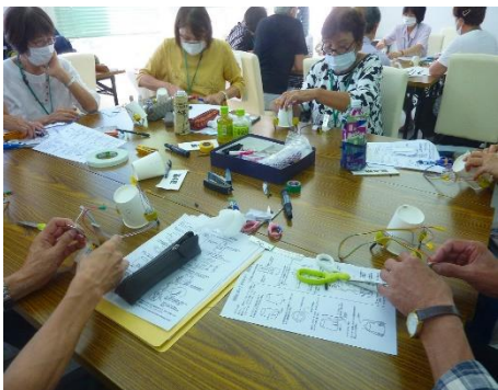
科学工作「ロボット」1