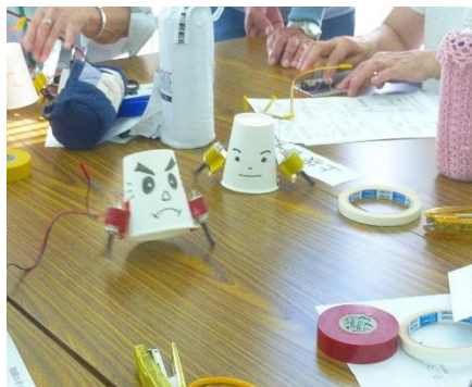
科学工作「ロボット」2