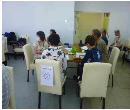
クラスミーティング 2班グループ