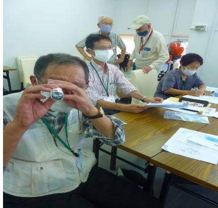
クラフト作品「万華鏡」1