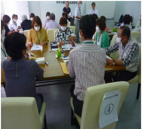
クラスミーティング 4班グループ