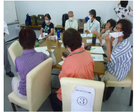
クラスミーティング 3班グループ