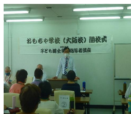
音田事業部長挨拶