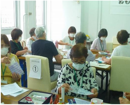
クラスミーティング 1班グループ