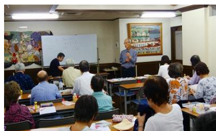
三田伝承おもちゃ事業部長