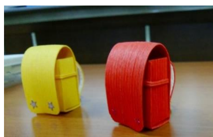
作品ランドセルキーホルダー